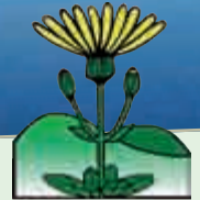
Naturpark Thüringer Wald